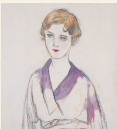
《着物の女》(部分) 1931-33年 紙本・鉛筆・淡彩