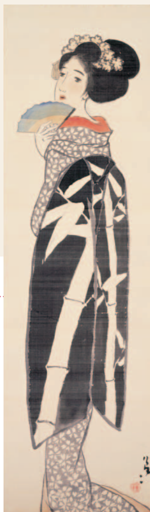
《舞妓舞扇》1917年 絹本・彩色