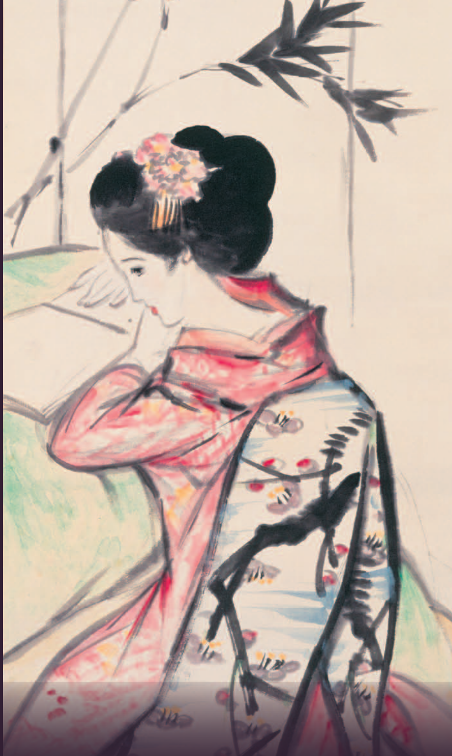
《南枝早春図》(部分) 昭和初期 紙本・彩色